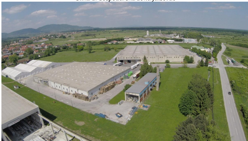
Slika 1. Gospodarska zona Jalševac

U narednim tablicama prikazana je struktura vlasništva unutar Zone i njeni raspoloživi kapaciteti.