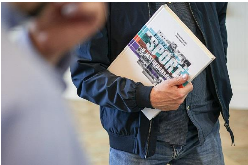
Slika 18. Sport u Jastrebarskom

Važno je istaknuti da se na knjizi radilo od 2021. godine, te tako, uz suradnju Zdenka Vukovića – Cene, Ratka Stojkovića i članica Zajednice, knjiga postaje važan zapis u očuvanju povijesti sporta i rekreacije našeg Grada.