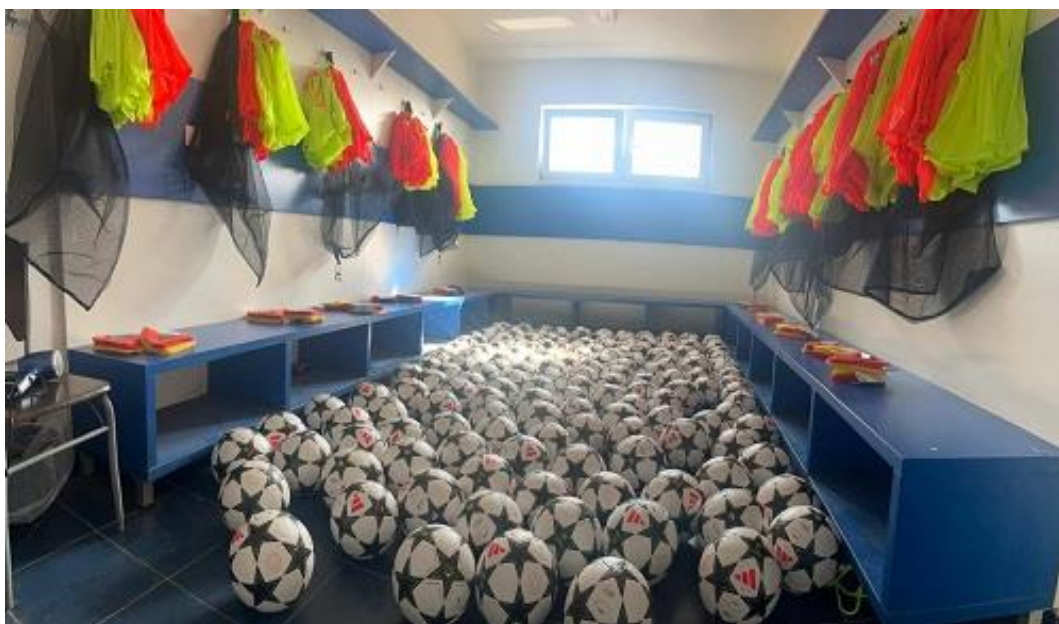
Slika 22. Nabavljena oprema za sve uzraste NK Jaska Vinogradar

Uz prethodno navedene trenere, Upravni odbor Zajednice kandidirao je i sportske klubove za sufinanciranje nabave sportske opreme. Tijekom 2025. godine preko javnog poziva odobrena su sredstva za nabavu sportske opreme i rekvizita sljedećim klubovima: Judo klubu Jaska, Nogometnom klubu Jaska Vinogradar, Kickboxing klubu Jaska, Stolnoteniskom klubu Jaska, Karate klubu Jaska i Streljačkom klubu Jastreb.