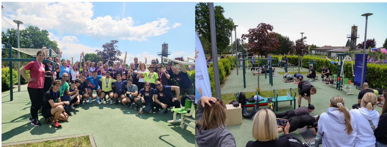
Slika 7 i 8.. Odlična atmosfera i druženje tijekom trećeg izdanja Najfit Jaskanac i Jaskanka

Sudjelovalo je preko 30 sudionika koji su uz potporu i bodrenje brojne publike prolazili zadatke. Cilj manifestacije i organizatora bio da se uz druženje i zabavu promovira rekreacijsko vježbanje koje ima višestruku korist.