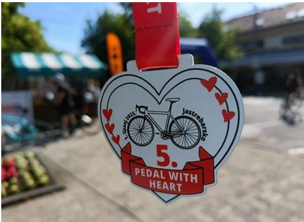
Slika 21. Početkom lipnja održana je 5. biciklijada „Pedal with heart“ u organizaciji Ivana Puškarića