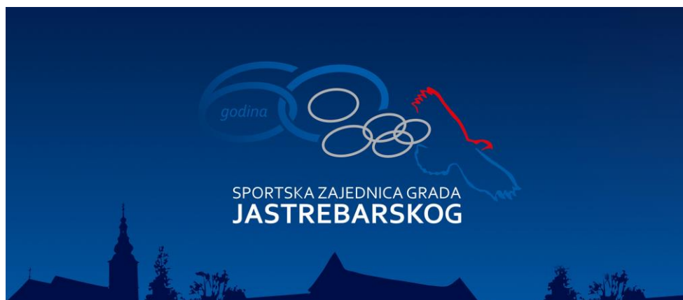
Slika 1. Sportska zajednica 2025. godine proslavila 60 godina postojanja

Jedinice lokalne i regionalne samouprave pa tako i Grad Jastrebarsko utvrđuju Javne potrebe u sportu i za njihovo ostvarivanje osiguravaju sredstva iz proračuna u skladu sa Zakonom o sportu. Sportska zajednica Grada Jastrebarskog krovna je udruga sportskih udruga na području Grada Jastrebarskog. Programom javnih potreba u sportu Grada Jastrebarskog u 2025. godini utvrđene su aktivnosti, poslovi i djelatnosti od značaja za sport u Gradu Jastrebarskom, kao i za njegovu promociju na svim područjima. Ciljevi i djelatnost Zajednice utvrđeni su na osnovi Zakona o sportu RH, a realizacija se temelji na Programima sportskih udruga članica Zajednice koje djeluju na području Grada Jastrebarskog. U nastavku dokumenta donosimo izvješće o radu i brojnim aktivnostima Zajednice i njenih članica.