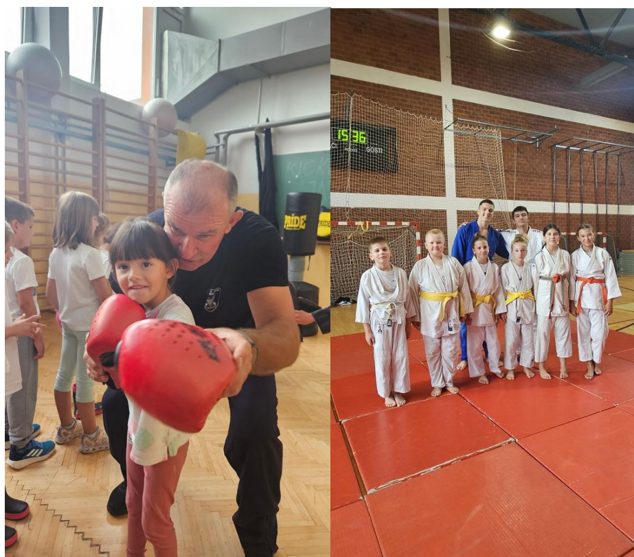
Slika 10. Uz školsku djecu, na obilježavanju HOD-a dolaze nam i starija vrtićka djeca i predškolski uzrast

Kao uspomenu na današnji dan, prisutnima je poklonjena tradicionalna bijela majica s logom HOO, Grada i Zajednice, te letak sa kontaktima trenera svih dvoranskih klubova radi upisa i dodatnih informacija. Obilježavanje HOD-a u postala redovita aktivnost Zajednice i klubova s ciljem upisa što većeg broj djece u sportske klubove.