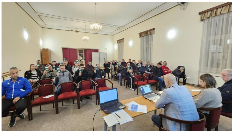
Slika 3. Sjednica Skupštine SZGJ u prosincu

U 2025. godini održano su dvije redovne sjednice. Na navedenim redovnim sjednicama usvojena su izvješća za prethodnu godinu i planovi za 2026. godinu.