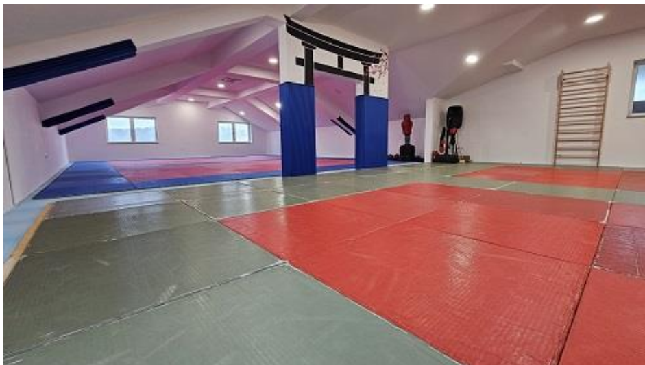
Slika 19. Nakon prvog uređenja kata SRC Centrala 2019. godine, potrebno je bilo zamijenit oštećene podove i zidove.

U sklopu održavanja i upravljanja sportskim objektima, tijekom ljetne stanke sportskih klubova, izvršeno je uređenje prostora na katu objekta SRC Centrala, koji klubovi redovito koriste za svoje trenažne aktivnosti. Radovi su obuhvaćali uklanjanje drvene podloge i postavljanje čvršće podloge, kao i dodatno ojačanje gipsanih ploča na zidovima. U sklopu dodatne zaštite od ozljeda, postavljene su zaštitne podloge na zidovima i stropu. Ukupna vrijednost investicije iznosila je 8.000,00 eura, a financirana je iz proračuna Sportske zajednice.