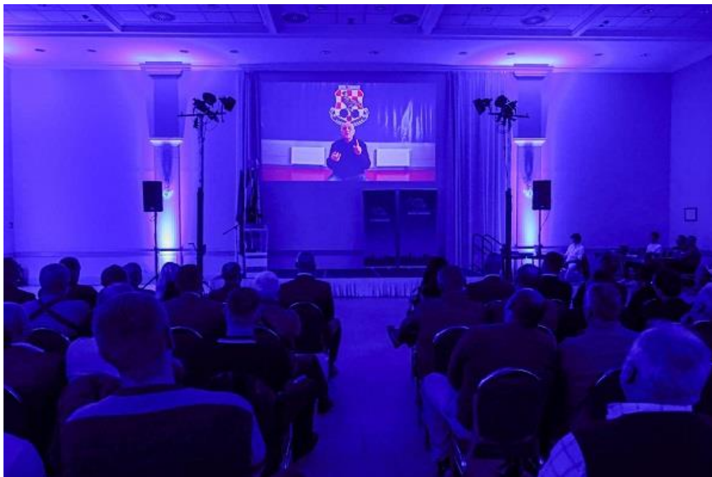
Slika 17. Film o sportskoj zajednici i ljudima koji žive sport