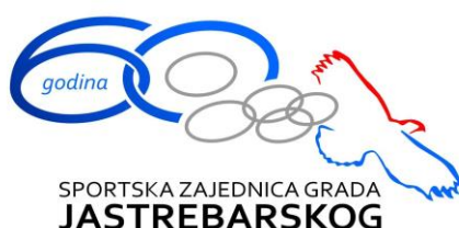
Slika 16. U sklopu proslave, izrađen je i prigodan logo Zajednice

Prošle godine Zajednica je obilježila značajan jubilej, odnosno 60 godina osnutka Sportske zajednice Grada Jastrebarskog. Te 1965. godine bio je početak organizirane potpore svim klubovima, sportskim entuzijastima i sportašima. Tijekom godine Zajednice je nizom aktivnosti obilježavala i slavila svoj 60-ti rođendan.