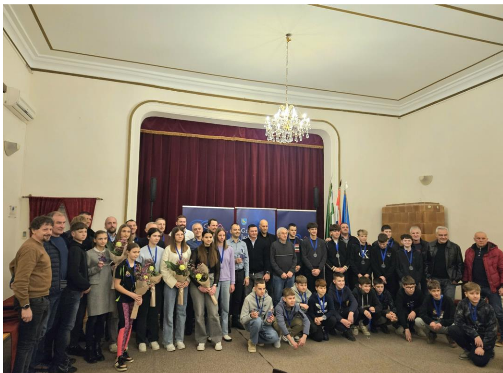
Slika 4. Zajednička slika najboljih u 2024. godini