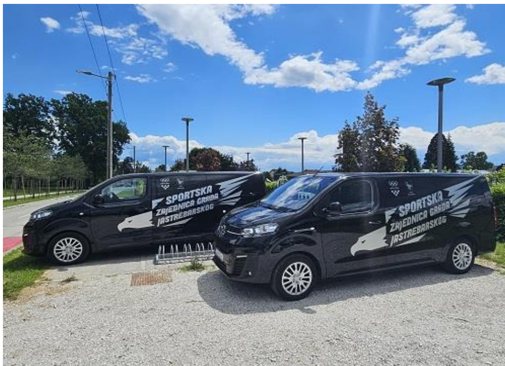
Slika 9. Nova kombi vozila

U 2025. godini nastavili smo sa projektom kombi vozila za naše članica koji se pokazao izuzetno uspješan i koristan. Nakon prodaje starih vozila, tokom veljače pokrenut je postupak nabavke novih vozila, te su krajem travnja nabavljena dva vozila marke Opel Zafira. Vozila su nabavljena, te će biti financirana preko financijskog leasinga na 5 godina, te sredstvima od prodaje starih vozila.