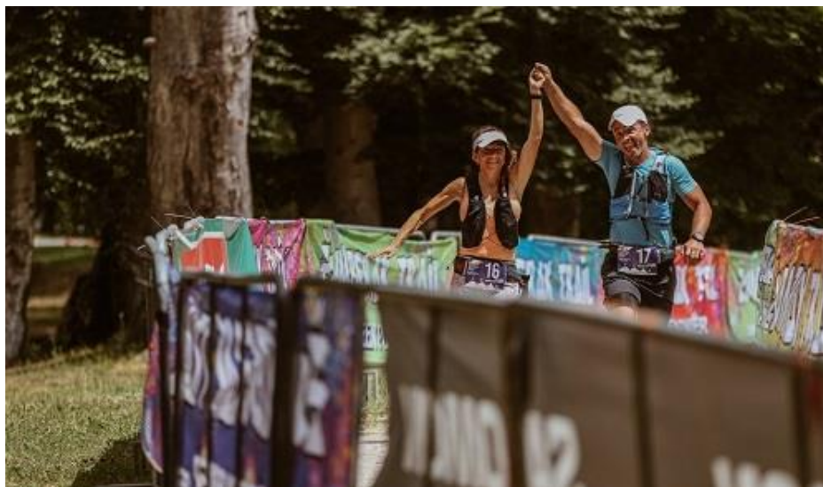
Slika 2. ŽUT – jedna od najvećih sportsko-rekreativnih događaja Zagrebačke županije