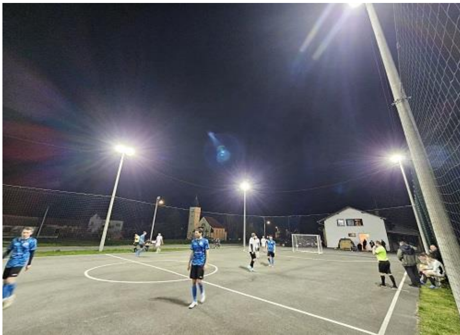
Slika. 20. Nova rasvjeta na igralištu Mnk Čeglji

Zbog loše i dotrajale rasvjete na malonogometnom igralištu u dogovoru s klubom, investirano je u kompletnu novu rasvjetu. Ukupna vrijednost investicije iznosila je 3.500,00 eura, a financirana je iz proračuna Sportske zajednice u sklopu održavanja i upravljanja sportskim objektima.