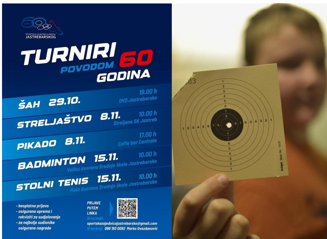
Slika 12. i 13. Plakat turnira i pogodak na streljaštvu.