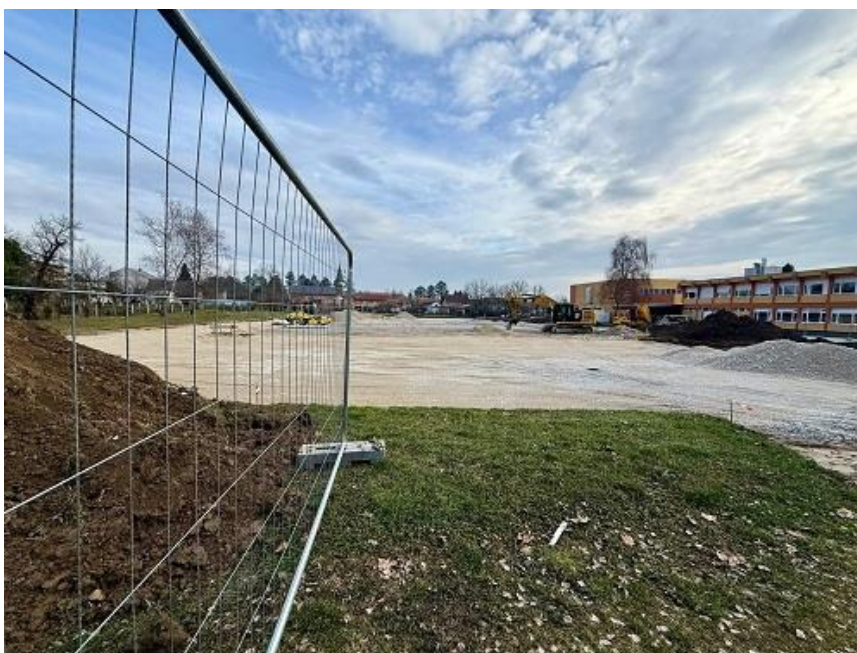
Slika 15. U 2026. godini izgraditi će se dugoočekivani kompleks atletskih staza s popratnim sadržajima na području OŠ Ljubo Babić

Nakon višegodišnjeg truda i rada na projektu kompleksa atletskih staza s dodatnim sadržajima, krajem godine krenula je izgradnja. Planirano otvorenje očekuje se tijekom mjeseca svibnja 2026. godine. Izgradnja navedenog projekta financirati će se sredstvima Ministarstva turizma i sporta, Grada Jastrebarskog i Zagrebačke županije, a predstavlja prvo kapitalno ulaganje u sportsku infrastrukturu na području Grada od izgradnje sportske dvorane Srednje škole Jastrebarsko. Vrijednost projekta iznosi više od 800.000,00 eura.