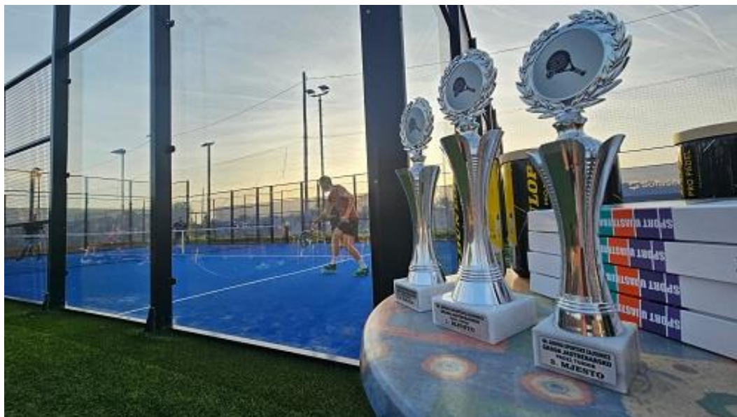
Slika 14. Turnir u padelu izazvao veliku zanimanje građana

Na navedenim turnirima sudjelovalo je više od 200 sugrađana, a ovim putem zahvaljujemo klubovima, prof. Ratku Stojkoviću, te Sport baru Centrala na pomoći i suradnji prilikom organizacije turnira.