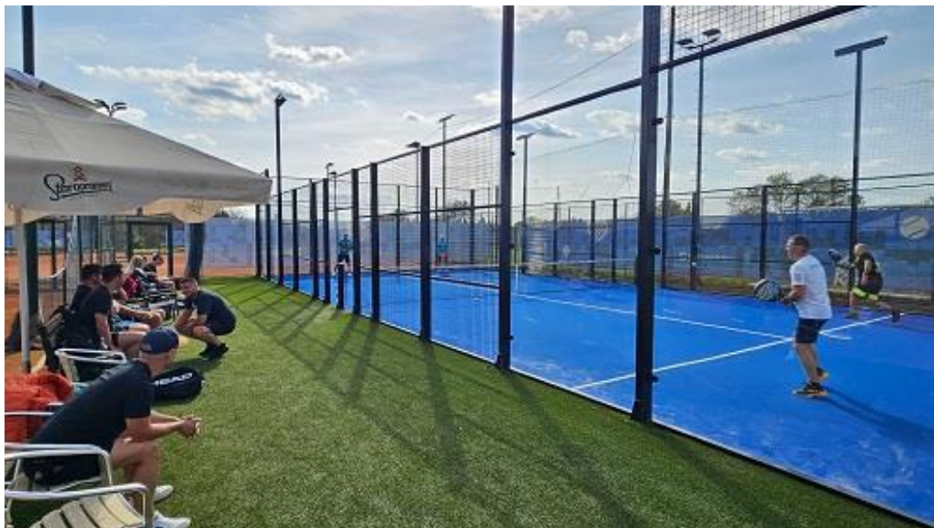
Slika 18. Padel igralište na SRC Centrali

Uz sufinanciranje Grada Jastrebarskog, suradnju Tenis kluba Tenis Jaska, te privatnu investiciju g. Zlatka Hrkaća, izgrađeno je prvo padel igralište u Jastrebarskom. S obzirom na to da je padel jedan od najbrže rastućih sportova u svijetu te da za njega postoji velik interes rekreativaca u Jastrebarskom, u planu je izgradnja još jednog padel igrališta. Ukupna investicija iznosila je 45.000,00 eura.