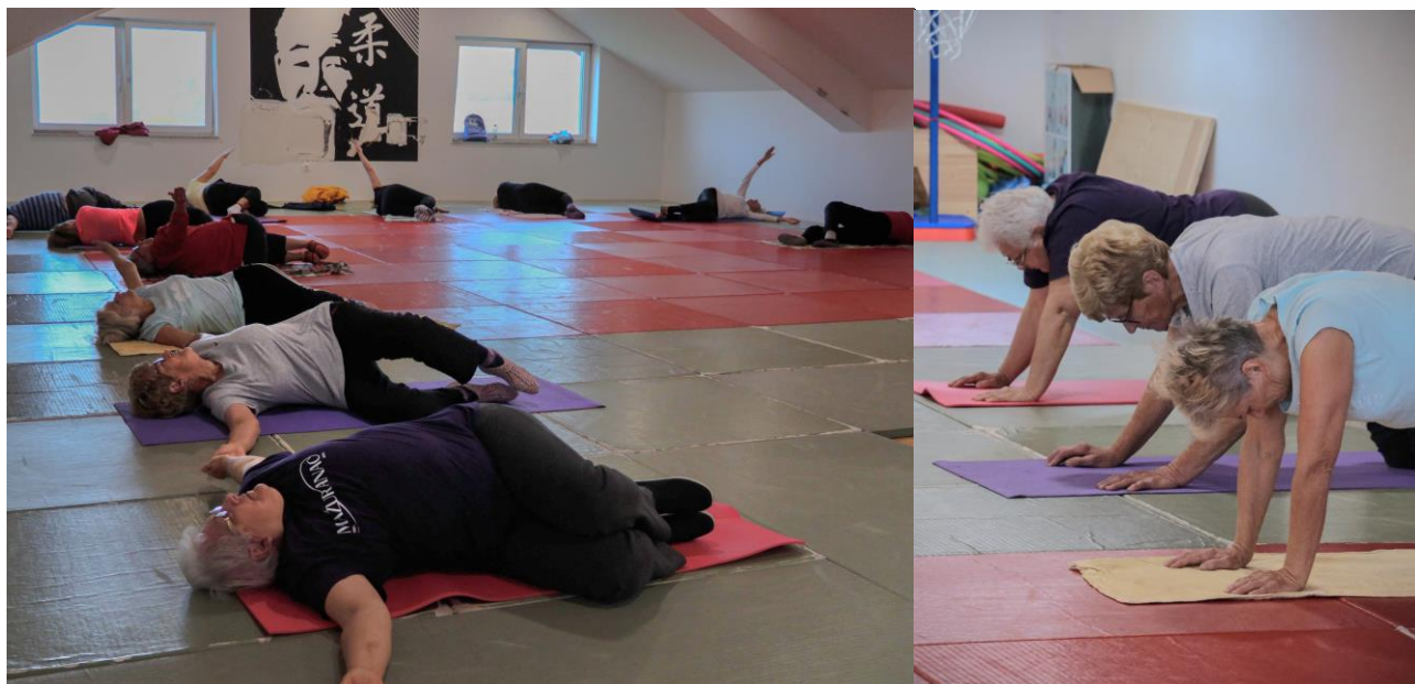
Slika 9. i 10. Program Besplatne korektivne gimnastike za osobe 3. životne dobi i umirovljenike provodi se u prostoru SRC Centrala