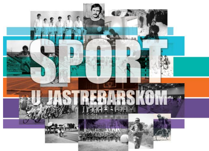
Slika 13. Naslovna slika knjige „Sport u Jastrebarskom“

Višegodišnji projekt koji ima za cilj očuvati bogatu sportsku baštinu Grada Jastrebarskog. Iako je prvotna ideja bila da se s obnovom i otvorenjem dvorca Erdody otvori i sportski muzej, planovi se malo promijenili, te se tijekom zadnjih tri godine radilo na pripremi knjige o povijesti sporta na području Grada Jastrebarskog. Tijekom 2024. godine uz suradnju Zdenka Vukovića – Cene i Ratka Stojkovića knjiga je završena i predana u tiskaru. Ovom knjigom obuhvaćena je bogata jaskanska sportska povijest kroz sportove, najistaknutije sportaše i zanimljivosti. Ovom knjigom će se sačuvati jedan dio povijesti života naših sugrađana koji je bio vezan za sport i rekreaciju u našem Gradu. Uz završetak knjige i dalje nastavljamo s prikupljanjem sportskih rekvizita za izložbu i sportski muzej. Knjiga sadrži preko 400 stranica tekstova i slika. Promocija se očekuje u mjesecu travnju.