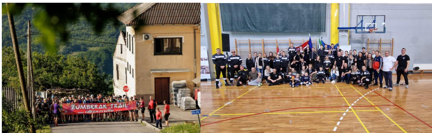
Slika 2. i 3. Jedan od startova ŽUT-a i ekipa Kickboxing kluba Jastreb na PH u Jastrebarskom

Zajednicu je završetkom 2024. godine činilo 33 članica različitih sportskih grana i rekreacija. Osim redovnih natjecateljskih aktivnosti, protekle godine održano je preko 30 većih manifestacija u suorganizaciji i organizaciji naših članica uz brojne manje klupske aktivnosti koje su uz članove kluba bili namijenjeni i za građane Grada Jastrebarskog. Od većih i značajnih manifestacija koje su se održale možemo istaknuti Žumberak trail (DZSIR Jastrebestreme) i Polumaraton memorijal Predrag Bošnjak (Ak Jastreb 99), Kup Jaska judo turnir (Judo klub Jaska), Jaska Winter cup (Mnk Jastreb), Nenina utrka (Ok Jelen) i prigodne poput Prvenstva Hrvatske u karateu (Karate klub Jastreb i Zajednica), te Prvenstvo Hrvatske u kickboxingu i 2. trening kamp reprezentacije Hrvatskog kickboxing saveza (Kickboxing klub Jastreb i Zajednica).