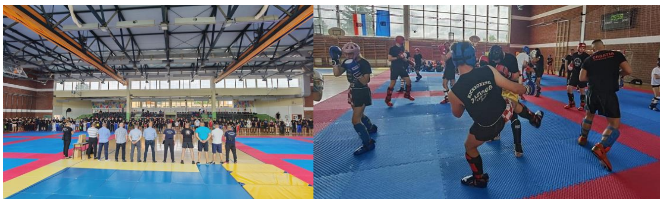
Slika 18. i 19.. Trening kamp reprezentacije Hrvatskog kickboxing saveza

U sportskoj dvorani Osnovne škole „Ljubo Babić“ u lipnju održan je pripremni kamp Hrvatskog kickboxing saveza na kojem su prisustvovali brojni državni prvaci u disciplinama tatami i ring. Navedeni kamp bio je izlučni i kvalifikacijski za ulazak u reprezentaciju. Okupilo se više od 110 najboljih sportaša u mlađim kategorijama u svim disciplinama kickboxinga s izbornicima, te predstavnicima klubova i nacionalnog saveza. Tehnički organizatori kampa bili su Sportska zajednica Grada Jastrebarskog i Kickboxing klub Jastreb. Također, kamp je iskorišten kao i dodatno usavršavanje i napredak mladih sportaša, te planiranje daljnjih aktivnosti saveza i reprezentacije.