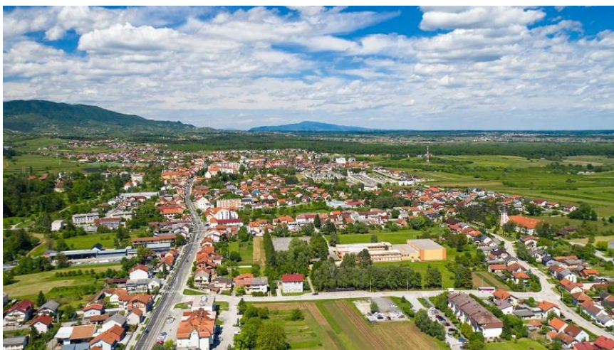
Slika 1. Grad Jastrebarsko – Europski grad sporta 2023. godine

Jedinice lokalne i regionalne samouprave pa tako i Grad Jastrebarsko utvrđuju Javne potrebe u sportu i za njihovo ostvarivanje osiguravaju sredstva iz proračuna u skladu sa Zakonom o sportu. Sportska zajednica Grada Jastrebarskog krovna je udruga sportskih udruga na području Grada Jastrebarskog. Programom javnih potreba u sportu Grada Jastrebarskog u 2024. godini utvrđene su aktivnosti, poslovi i djelatnosti od značaja za sport u Gradu Jastrebarskom, kao i za njegovu promociju na svim područjima. Ciljevi i djelatnost Zajednice utvrđeni su na osnovi Zakona o sportu RH, a realizacija se temelji na Programima sportskih udruga članica Zajednice koje djeluju na području Grada Jastrebarskog. U nastavku dokumenta donosimo izvješće o radu i brojnim aktivnostima Zajednice i njenih članica.