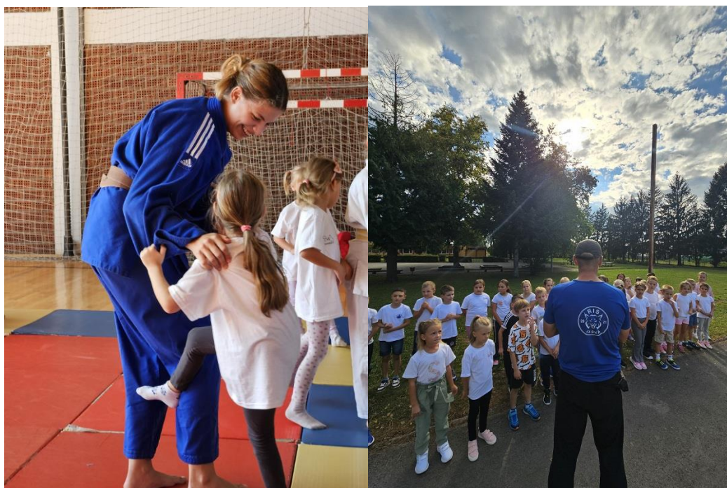
Sika 14. i 15. Obilježavanje HOD-a u postala redovita aktivnost Zajednice i klubova s ciljem upisa što većeg broj djece u sportske klubove.

Kao uspomenu na današnji dan, prisutnima je poklonjena tradicionalan bijela majica s logom HOO, Grada i Zajednice, te letak sa kontaktima trenera svih dvoranskih klubova radi upisa i dodatnih informacija.