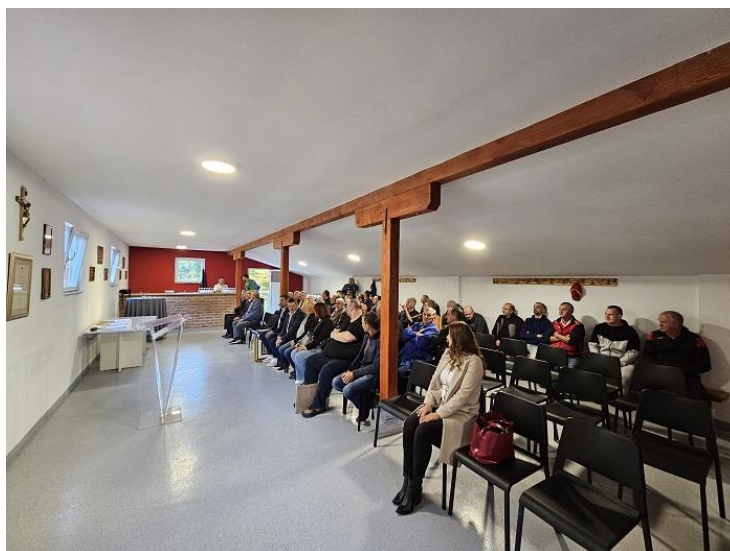
Slika 22. Svečana sjednica NK Sveta Jana povodom 50. obljetnice u novouređenim prostorijama kluba

Krajem godine 2023. godine Grad Jastrebarsko krenuo je u potpuno obnovu kata sportskog objekta nogometnog kluba Sveta Jana. Tijekom prve polovice prošle godine investicija je završena, a javnosti je predstavljena u sklopu obilježavanja 50. obljetnice kluba. U sklopu uređenja objekta, nabavljen je i agregat čime se rješava problem snabdijevanja električnom energijom na samom objektu. Navedena ukupna kapitalna investicija iznosi više 70.000,00 eura.