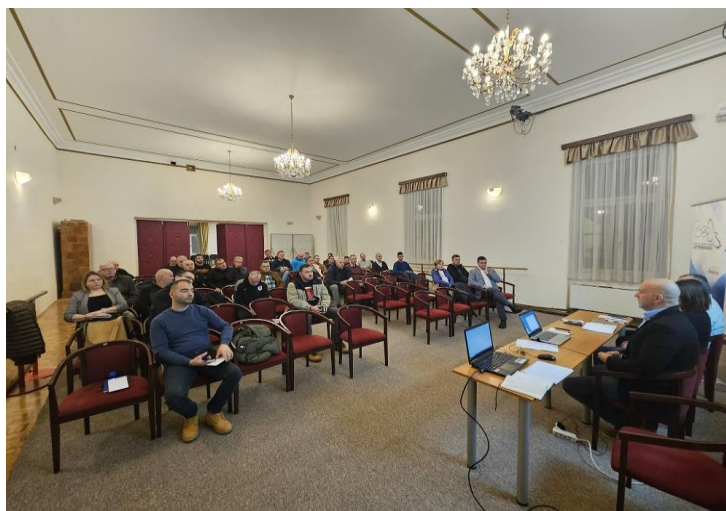
Slika 5. Sjednica Skupštine SZGJ u prosincu

U 2024. godini održano su dvije redovne sjednice. Na navedenim redovnim sjednicama usvojena su izvješća za prethodnu godinu i planovi za 2024. godinu.