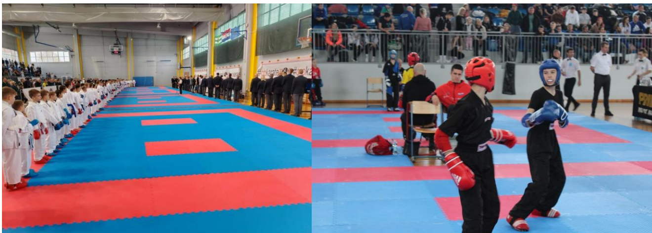
Slika 16. i 17. Preko 1000 mladih sportaša sudjelovalo je na Prvenstvima Hrvatske u karateu i kickboxingu u Jastrebarskom

Tako je tijekom ova dva prvenstva u Gradu bilo prisutno preko 1000 mladih sportaša sa roditeljima, trenerima i ostalom pratnjom iz cijele Hrvatske. Uz nacionalni karate i kickboxing savez koji su bili glavni organizatori prvenstva, tehnički organizatori natjecanja bili su Sportska zajednica Grada Jastrebarskog, Karate klub Jastreb i Kickboxing klub Jastreb.