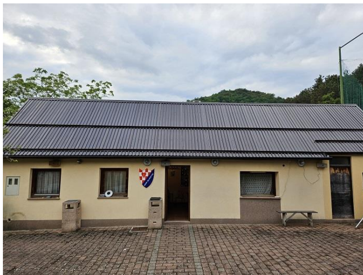
Slika 21. Obnovljeno krovište Malonogometnog kluba Slavetić

Sportska zajednica u suradnji s Gradom osigurali su sredstva za obnovu krovišta na objektu kluba. Ovim ulaganjem postavljeno je kompletno novo krovište, a cjelokupna investicija iznosila je 23.000,00 eura.