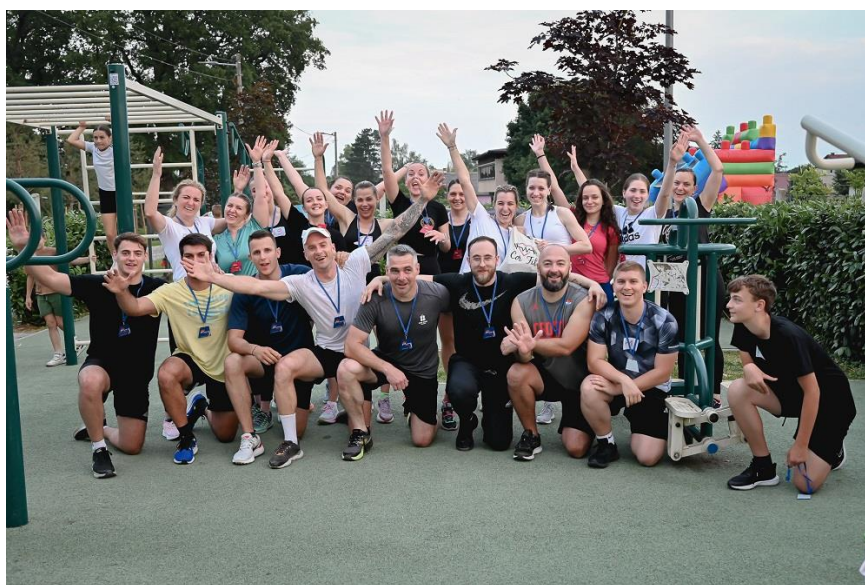
Slika. 11. Odlična atmosfera i druženje tijekom drugog izdanja Najfit Jaskanac i Jaskanka

Sudjelovalo je preko 30 sudionika koji su uz potporu i bodrenje brojne publike prolazili zadatke. Cilj manifestacije i organizatora bio da se uz druženje i zabavu promovira rekreacijsko vježbanje koje ima višestruku korist.