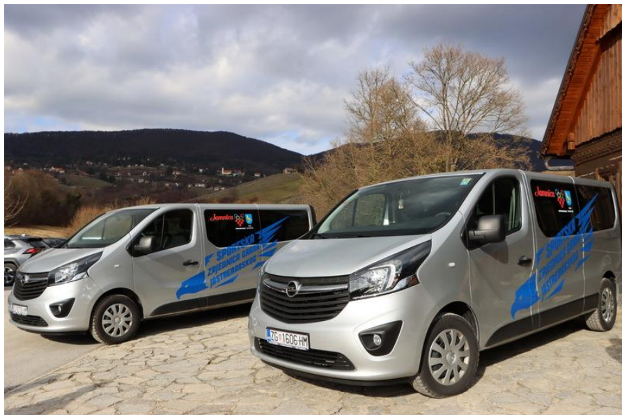
Slika 12. Nabavljena kombi vozila 2020. godine bili su od velike pomoći klubova prilikom odlaska na natjecanja diljem Hrvatske i Europe.

djelomično će se financirati nabavka novih vozila u 2025. godini. Nova kombi vozila očekujemo tijekom mjeseca ožujka.