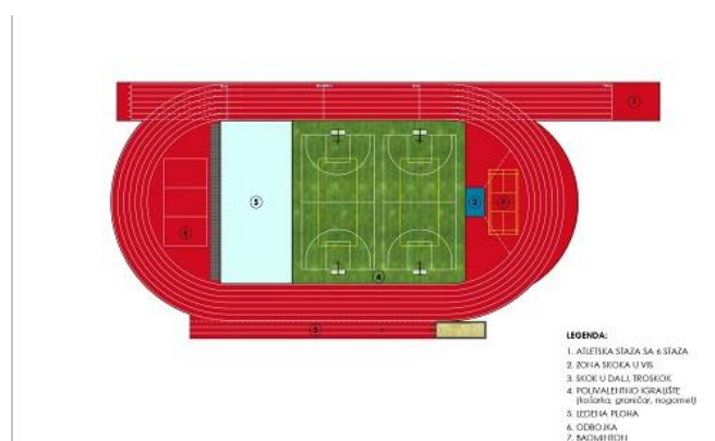
Slika 20. U 2025. godini izgraditi će se dugoočekivani kompleks atletske staze s popratnim sadržajima

Višegodišnja ideja i projekt Zajednice intenzivirao se odlukom Grada da se projekt prijavi na predmetni natječaj. Tako se tijekom lipnja i srpnja ubrzano radilo na pripremi dokumentacije, a Sportska zajednica kao glavni koordinator uz pomoć tvrtke ESG Insight d.o.o uspješno je pripremila cjelokupnu dokumentaciju za prijavu na predmetni natječaj. U veljači 2025. godine objavljeni su rezultati natječaja, te će Ministarstvo projekt sufinancirati s iznosom od 300.000,00 eura.