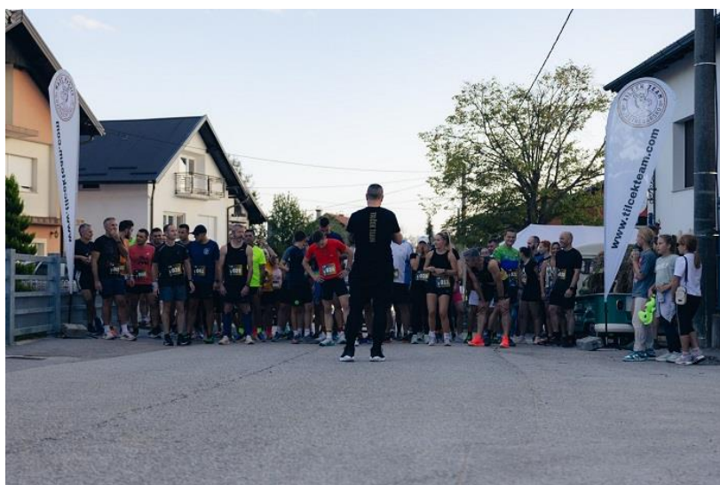
Slika 23. Start premijerne Lige Tilčekov put

U sklopu stavke Sufinanciranje novih sportskih manifestacija, podržano je Prvenstvo Hrvatske u sigurnoj vožnji, humanitarna biciklijada Pedal with heart, rekreacijska liga Tilčekov put (SK Tilček team), te nacionalna prvenstva u karateu i kickboxingu.