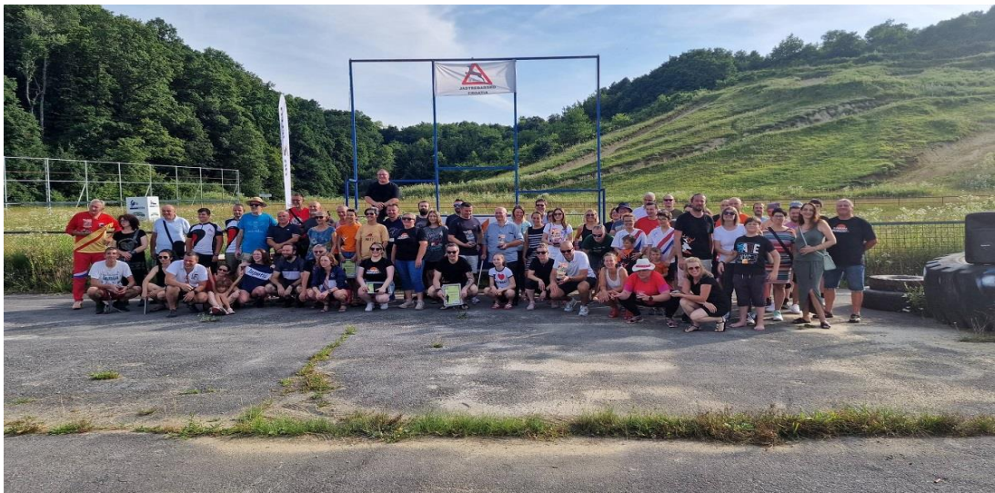
Slika 6. Obilježavanje 30 godina postojanja OK Jelen uz retro utrku u Mladini